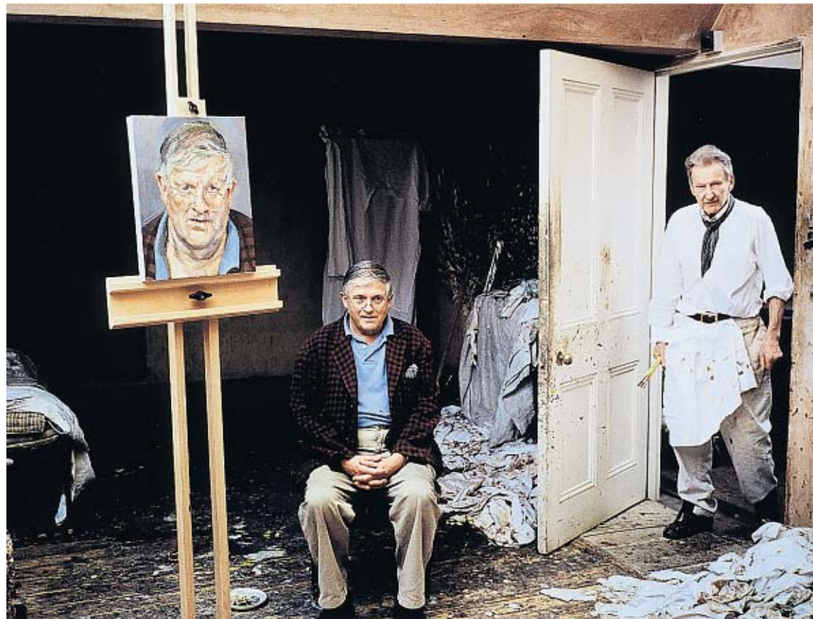
David Hockney (links) en Lucian Freud in 2003.

Opeens is er een oog, hangend in het witte niets